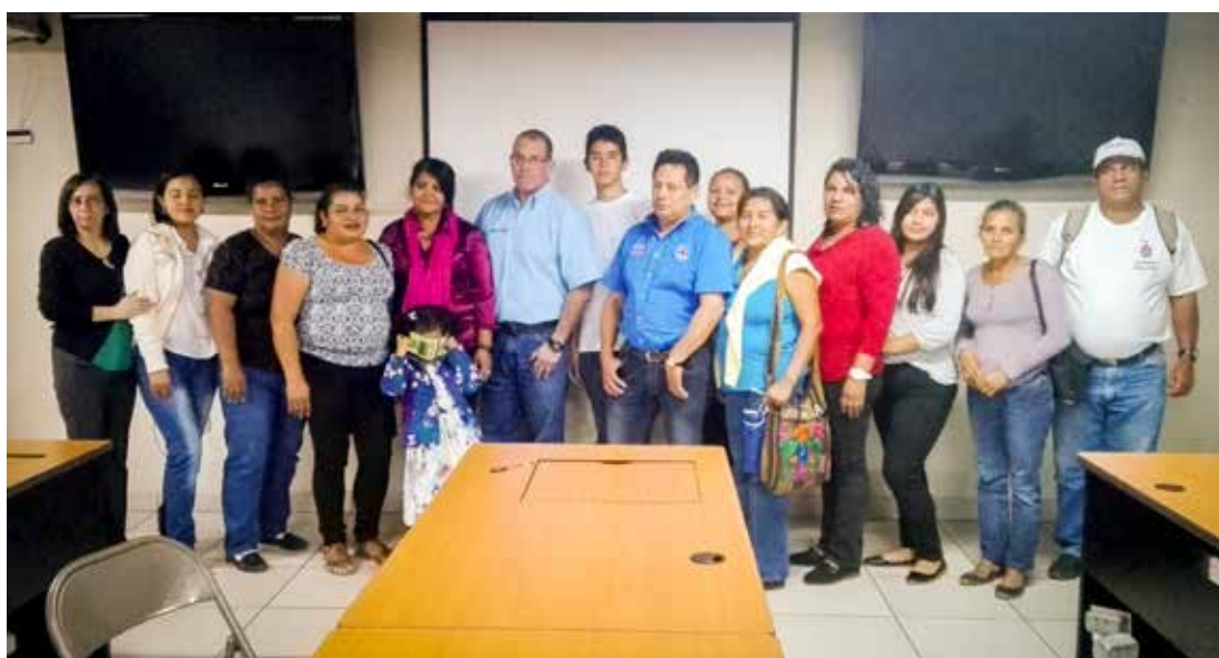
Participantes del proyecto en actividades de capacitación.

Generar aprendizajes basados en las experiencias desarrolladas por el “ Proyecto Resiliencia Urbana ” e identificar los elementos sustantivos para la consolidación y sostenibilidad de los procesos desarrollados en las colonias objeto de la intervención.