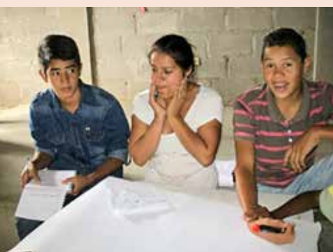
Red de Jóvenes de la colonia Nueva Capital.

● Hay dificultades que están asociadas a la dinámica propia o a las características socioculturales del grupo de edad: desintegración, no disponibilidad de infraestructura para la participación; migración de jóvenes, embarazo adolescente; limitaciones económicas. Otras situaciones que están señaladas como dificultades, son amenazas del entorno: discriminación, no disponibilidad de infraestructura para la recreación y participación.