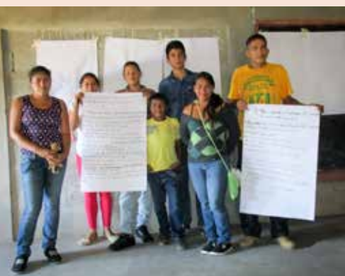
Red de Jóvenes de la colonia Generación 2000.