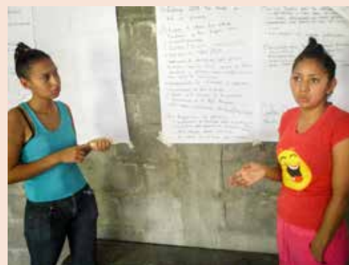
Red de Jóvenes de la colonia Mary Flakes de Flores.